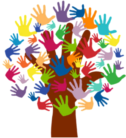
„Helfende Hände“

Ein Gottesdienst spät abends; kann das gehen? Wir wollen es ausprobieren. Was an Heiligabend geht, das sollte im Juni doch erst recht