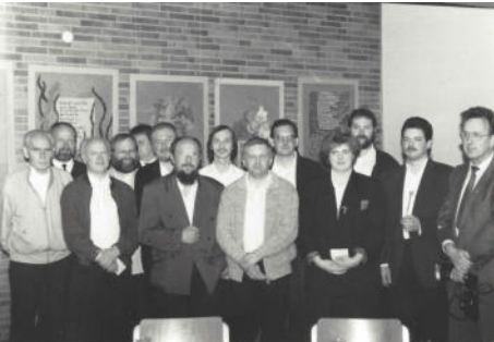
Sein zehnjähriges Bestehen feierte der Posaunenchor Bomlitz 1992 im Rahmen des Kreisposaunenfestes. Mittlerweile sind von den in Spitzenzeiten 18 Mitgliedern noch vier dabei.

Musik nimmt in der Gottesdienst-Gestaltung viel Raum ein und das nicht von ungefähr: Melodien öffnen die Sinne und den Geist, erreichen das Herz, wo Worte es nicht vermögen. Seit 40 Jahren ist der Posaunenchor Bomlitz ein treuer Begleiter des Bomlitzer Gemeindegewesens und auch heute zur Stelle, wenn in der Paulusgemeinde Bläsermusik gewünscht ist.