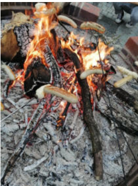
Stärkung am Lagerfeuer