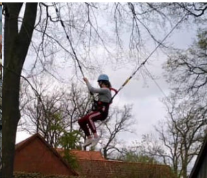
Und ab geht's in den freien Fall.