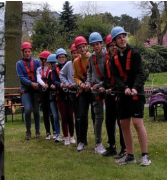
Wer gerade nicht klettert, wird zum Sichern gebraucht