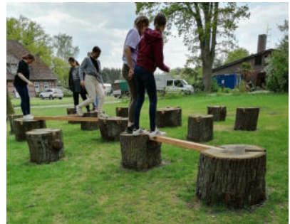
Nur gemeinsam kommt man ans Ziel.