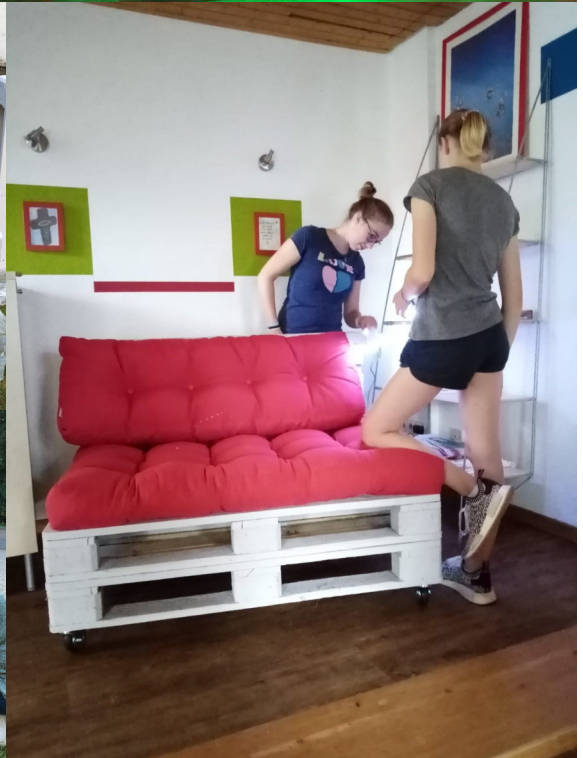
Palettenmöbel für den Jugendraum gebaut