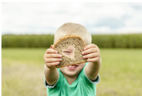
N. Schwarz © GemeindebriefDruckerei.de

Mir begegnete dieser Vers neulich, als Eltern ihn als Taufspruch für ihren Sohn ausgewählt hatten. Das Herz soll behütet werden. Es soll darauf