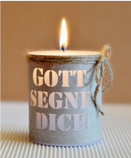
N. Schwarz © GemeindebriefDruckerei.de

Am 11. September feiern wir Diamantene Konfirmation. Alle, die 1960, 1961 oder 1962 in Bomlitz konfirmiert wurden, sind herzlich eingeladen, mit uns ihre Diamantene Konfirmation zu feiern! Einen festlichen Rahmen bekommt der Gottesdienst durch die Chormusik. Da an dem Wochenende ein Chorfest bei uns in der Region stattfindet, haben sich zwei Chöre aus Hessen - das Herchenröder-Quartett 1913 e.V. und der Evangelischer Kirchenchor Zeilsheim – angeboten, im Gottesdienst am 11. September mitzuwirken.