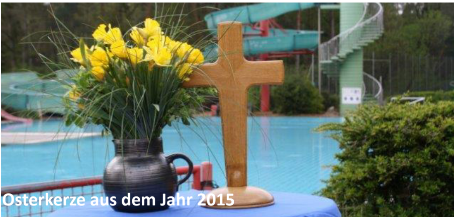
Osterkerze aus dem Jahr 2015